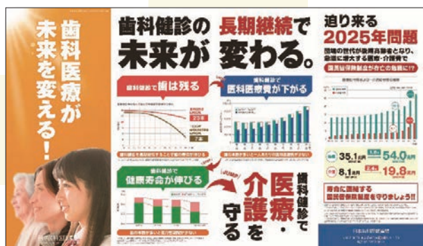
前弾のレイアウトをベースに今回はオレンジを基調として違いを明確に表現

なお、近日中に本連盟ホームページ(会員向け)に掲載予定ですので、是非本連盟ホームページをご覧ください。