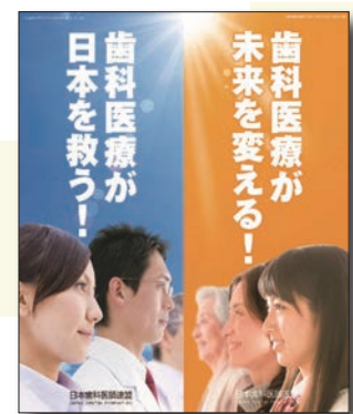
1弾と2弾を組み合わせると...このとおり!