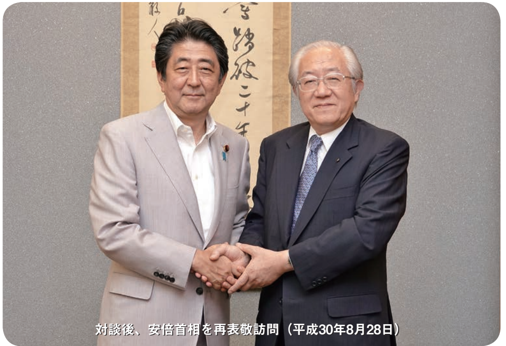
対談後、安倍首相を再表敬訪問(平成30年8月28日)